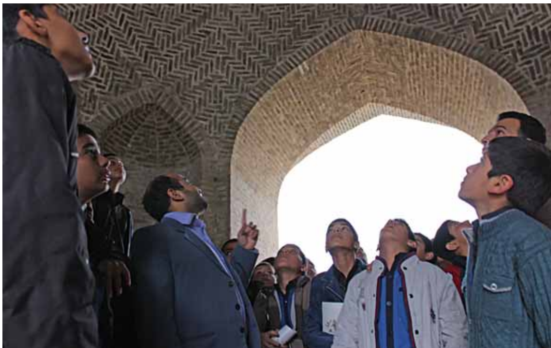
بازدید از مقبره عارف قطب‌الدین حیدر، ۱۳۹۳

همان‌طور که همه عزیزان و همکاران فرهنگی دست‌اندرکار تعلیم و تربیت می‌دانند و به شهادت اکثر تحقیقات علمی و زمینه روان‌شناسی رشد و تربیتی، فردی در آینده موفق می‌شود و به کمال می‌رسد که از لحاظ ذهنی و حرکتی به