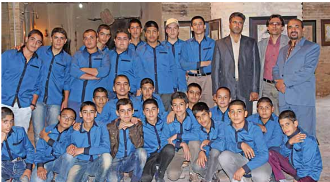
کارگاه تخصصی هنر، مهرماه ۱۳۹۳

به طراحی و رنگ آمیزی مدرسه با نقوش هندسی اسلامی و به شیوه قدیم دست زدیم که تجربه‌ای موفق و به یادماندنی برای من و دانش آموزانم شد