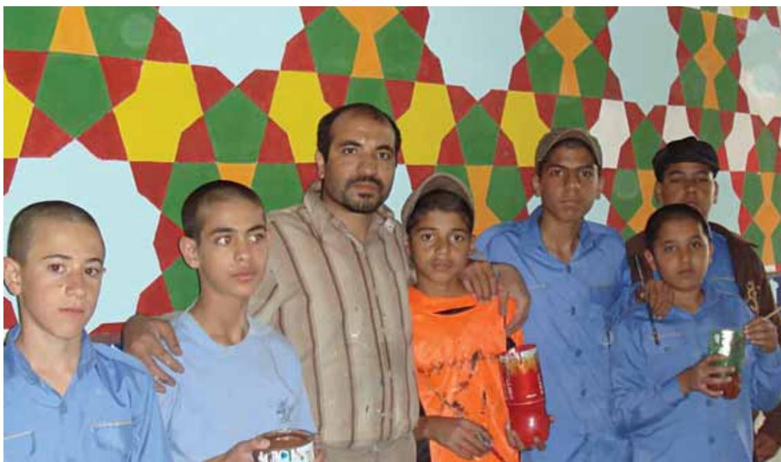
تزئین دیوار مدرسه با نقوش اسلامی در تربیت حیدریه، ۱۳۸۵